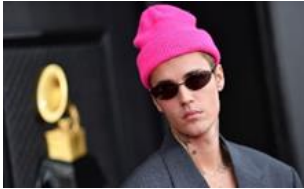
Justin BIEBER (chanteur)

Atteint du syndrome de Ramsay Hunt (maladie infectieuse caractérisée par un zona auriculaire associé à une paralysie périphérique du nerf facial). Cette maladie touche généralement des personnes âgées ou immunodéprimées. L'injection anti-covid peut provoquer un déficit immunologique.